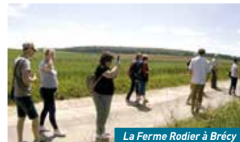
La Ferme Rodier à Brécly

en-Brie ou de Pargny-la-Dhuys et la brasserie à Fère-en-Tardenois, Condé-en-Brie, Nogentel, Rozoy-Bellevallée et Trélou-sur-