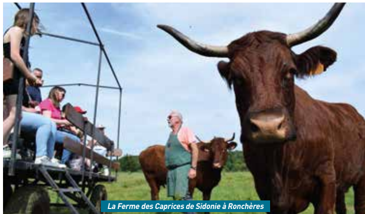
La Ferme des Caprices de Sidonie à Ronchères

Coup double pour la CARCT : tandis que l'année dernière, 11 exploitants participaient à cette manifestation, ils étaient 22 cette année. Parmi eux, ils exercent des activités aussi différentes que la production de farine avec un moulin à Rozet-Saint-Albin, de l'agroforesterie à Brécly, la pro-