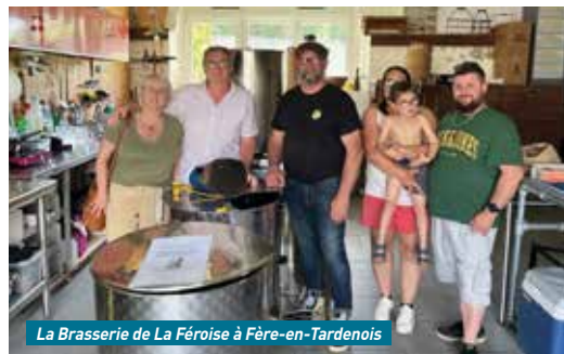
La Brasserie de La Féroise à Fère-en-Tardenois