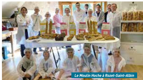
Le Moulin Hoche à Rozet-Saint-Albin