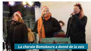
La chorale Bomokeurs a donné de la voix

À noter que ces professionnels du spectacle de rue étaient déjà venus à Château-Thierry il y a quelques années. Le grand chapiteau lumineux qui recouvre l'essentiel de la place de l'hôtel de ville s'est également allumé. Quelques minutes plus tard, toute la délégation a traversé la Marne lors d'une retraite aux flambeaux guidée par le Père Noël en personne pour rejoindre la place du Maréchal-Leclerc afin de faire la même opération autour du