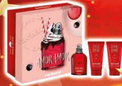
CACHAREL - AMOR AMOR Coffret Eau de toilette 50ml + 2 laits corps 50ml