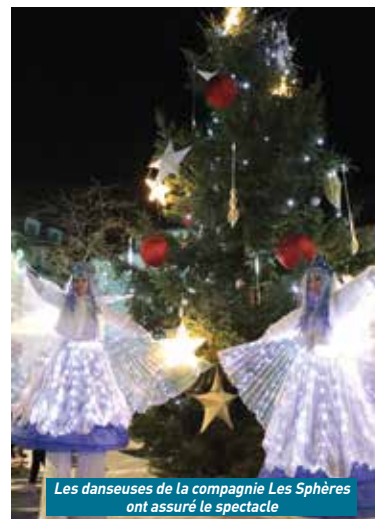
Les danseuses de la compagnie Les Sphères ont assuré le spectacle

grand sapin. Tous les participants ont pu alors profiter de breuvages et de marrons chauds en musique avec la chorale Bomokeurs. Un véritable moment de convivialité important en ces temps troubles ●