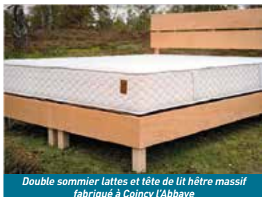
Double sommier lattes et tête de lit hêtre massif fabriqué à Coigny l'Abbaye

Aujourd'hui, Nation Literie présente une gamme de 40 modèles de matelas aux confort distincts : extra-souple, souple, mi-ferme, ferme et extra-ferme. A la tête de ce fleuron de notre département, Maurice Gamblin adapte le matelas à la morphologie de chacun.