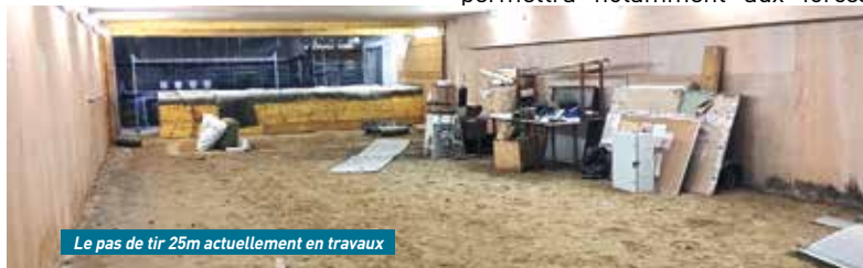
Le pas de tir 25m actuellement en travaux

de police nationale de s'entraîner à Château-Thierry sans devoir aller à Soissons ou Laon comme jusqu'ici, ce qui permettra de leur faire gagner un temps précieux. Pour rappel, le club propose des initiations au tir et dispose d'une école adaptée pour les enfants dès l'âge de 8 ans, où ils pourront pratiquer le tir sportif à la carabine ou au pistolet en position debout sur une cible située à 10 m. Les licenciés pourront également participer aux différentes compétitions départementales, régionales et nationales. Les armes, munitions et cibles sont fournies par le club. Plus de renseignements sur le site www.tirlemousquet.fr ●