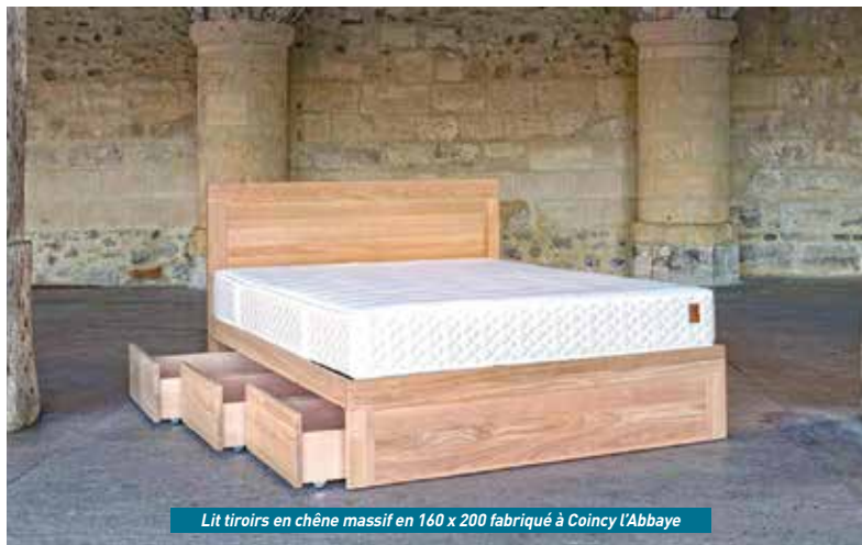
Lit tiroirs en chêne massif en 160 x 200 fabriqué à Coigny l'Abbaye

Nation Literie propose toutes les technologies qui existent sur le marché : matelas ressorts, à lattes, mémoire de forme/HR, Waterbed... « Choisir son matelas, c'est d'abord l'essayer. Le choix du confort d'un matelas est très personnel car chaque personne a sa propre morphologie. Vous pouvez choisir deux confort dans un seul matelas comme par exemple ferme d'un côté