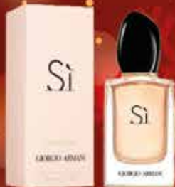
ARMANI - Si Eau de parfum 50ml