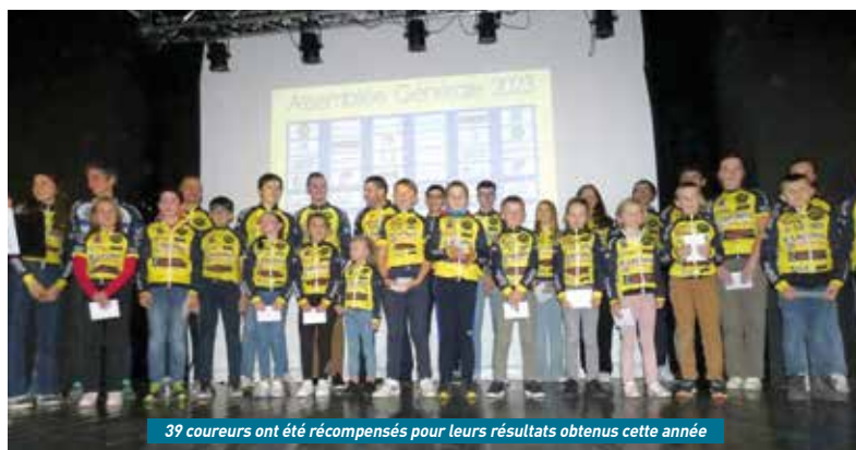
39 coureurs ont été récompensés pour leurs résultats obtenus cette année

Depuis sa création en 1981, l'ECCT s'appuie sur une politique qui se définit en 2 axes principaux : la formation et la compétition. Et 2023 n'a pas dérogé à la règle, bien au contraire. En effet, le club castel termine l'année avec 146 licenciés, dont 78 de moins de 18 ans et un pourcentage féminin en nette progression. Soixante jeunes fréquentent chaque semaine l'école vélo / VTT et s'épanouissent sous la houlette de 16 encadrants. Le VTT