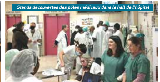
Stands découvertes des pôles médicaux dans le hall de l'hôpital

dans de nouveaux bâtiments situés Route de Verdilly. L'inauguration officielle a lieu le 4 mars 1983. L'hôpital a beaucoup évolué ces dernières années, mais reste à taille humaine. L'un des points forts est qu'il dispose d'un plateau technique assez complet qui peut offrir à la population un service de radiologie compétent, avec 1 scanner et 2 IRM. Le centre dispose de toutes les spécialités chirurgicales principales : viscérale, orthopédique, urologique, gynécologique, vasculaire, veineuse, stomato, ophtalmologique et ORL. La maternité, quant à elle, a obtenu en 2015 (renouvelé