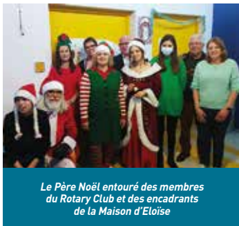
Le Père Noël entouré des membres du Rotary Club et des encadrants de la Maison d'Eloïse

Ce moment rare et privilégié a eu lieu ce mercredi 13 décembre au sein de l'Institut Médico-Educatif (IME) de Château-Thierry. Cette année encore, les 30 enfants et