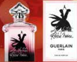
GUERLAIN La Petite Robe Noire Eau de parfum 50ml