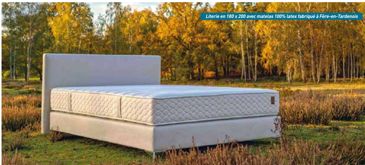
Literie en 180 x 200 avec matelas 100% latex fabriqué à Fère-en-Tardenois

Le showroom pour essayer les matelas se trouve à Armentières-sur-Ourcq sur la D1 entre Château-Thierry et Soissons. Vous serez accueilli du mardi au samedi inclus ●