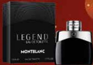
MONTBLANC - LEGEND Eau de toilette 50ml