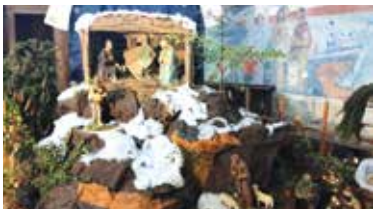
La crèche créée par les fidèles de l'église Saint-Crépin

Selon une solide tradition, depuis le 13 e siècle, la crèche vient décorer nos maisons. A l'origine, c'est Saint-François d'Assise, qui a eu la brillante idée de faire la première crèche vivante dans le village de Greccio au nord-est de l'Italie. L'engouement suscité ne s'est jamais démenti, et désormais chaque maison de chrétien, chaque église, chaque village et bien d'autres encore, ont leur propre crèche. En France, la crèche fait partie de notre patrimoine culturel grâce à l'indétrônable pastorale des santons de Provence, datée du 19 e siècle, mais héritière des poésies médiévales. Celle-ci nous rassemble avec humour la naissance du Christ et nous aide à entrer dans la joie de Noël. Il est bon de la réécouter chaque année le soir de Noël.