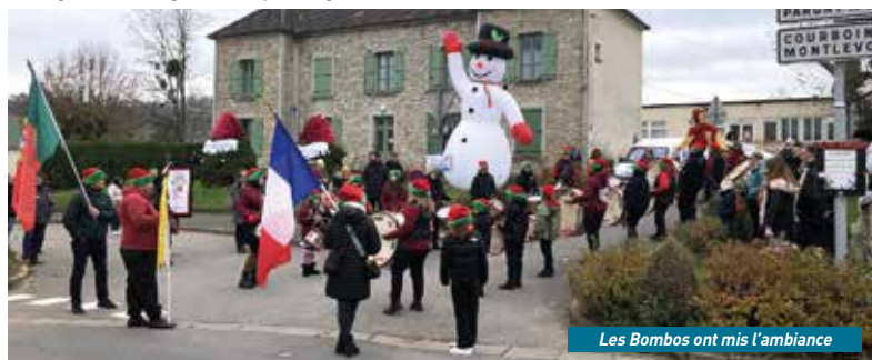
Les Bombos ont mis l'ambiance