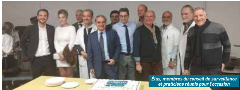
Élus, membres du conseil de surveillance et praticiens réunis pour l'occasion

en 2020), le label Initiative Hôpital Ami des Bébés (IHAB), gage d'un accompagnement de qualité pour les parents comme pour les bébés. Le centre hospitalier est également investi dans le champ de la prévention au travers de son Pôle de Santé Publique et de l'éducation thérapeutique, pour offrir d'autres prestations de santé. D'autre part, un Service de Soins Infirmiers à Domicile (SSIAD) permet le relais entre l'hospitalisation et le retour des patients chez eux. Enfin, l'établissement prend en charge la santé des personnes détenues au centre pénitentiaire de Château-Thierry ●