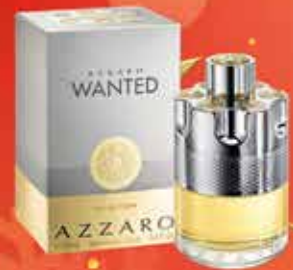
AZZARO - WANTED Eau de toilette 100 ml