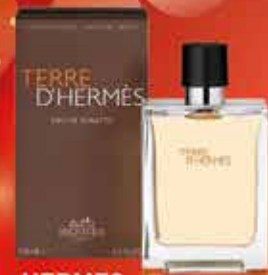
HERMÈS TERRE D'HERMÈS Eau de toilette 100ml