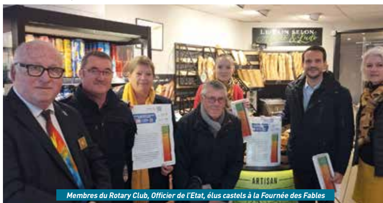
Membres du Rotary Club, Officier de l'Etat, élus castels à la Fournée des Fables