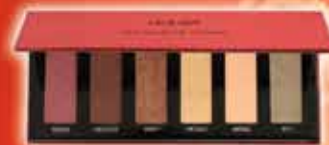
Ma Palette Chérie Palette de 6 fards à paupières