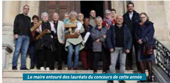
Le maire entouré des lauréats du concours de cette année

La 22 e édition du concours municipal des maisons fleuries a trouvé son épilogue le samedi 25 novembre à l'hôtel de ville avec la traditionnelle cérémonie de remise des prix où 17 habitants ont été récompensés pour le fleurissement de leurs balcons, fenêtres ou jardins.