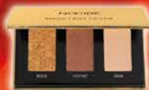
Mon Trio Festif Palette de 3 fards à paupières