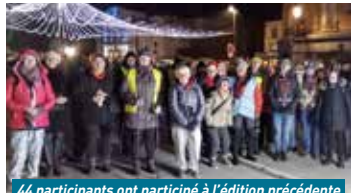
44 participants ont participé à l'édition précédente

avec une participation demandée de 5 euros, le dimanche 17. L'accueil se fera à partir de 8h30 au Port à sable face au Palais des