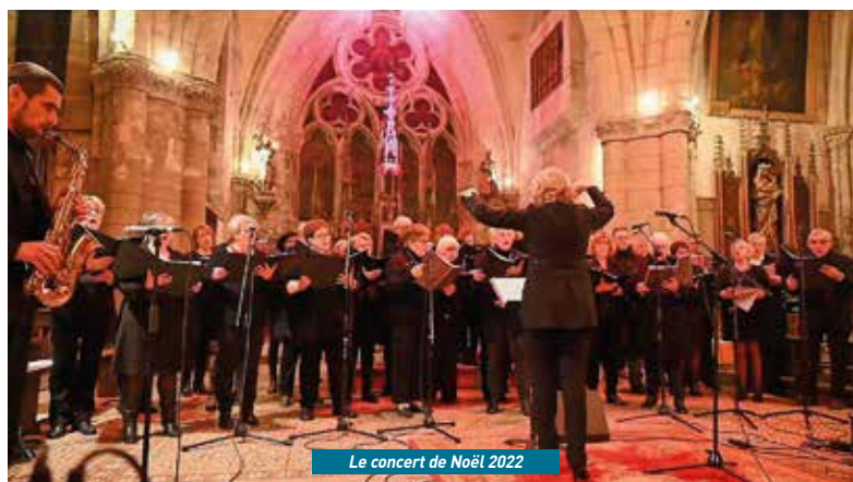
Le concert de Noël 2022

Sur la place Rémy Petit, comme tous les ans, la patinoire sera accessible tous les mercredis et samedis du mois de 15h à 19h. Le mercredi 6 à 18h, Saint-Nicolas, patron protec-