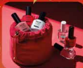
Ma Hotte à Vernis Coffret de 5 vernis à ongles, 1 embellisseur et 1 tout-en-un base & top coat