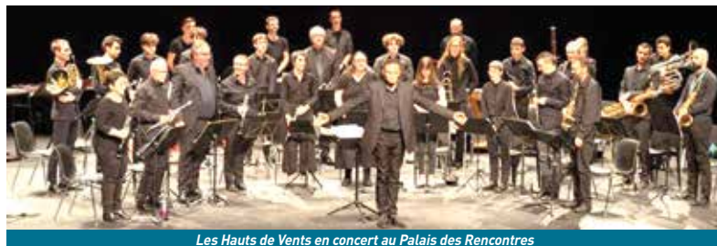
Les Hauts de Vents en concert au Palais des Rencontres