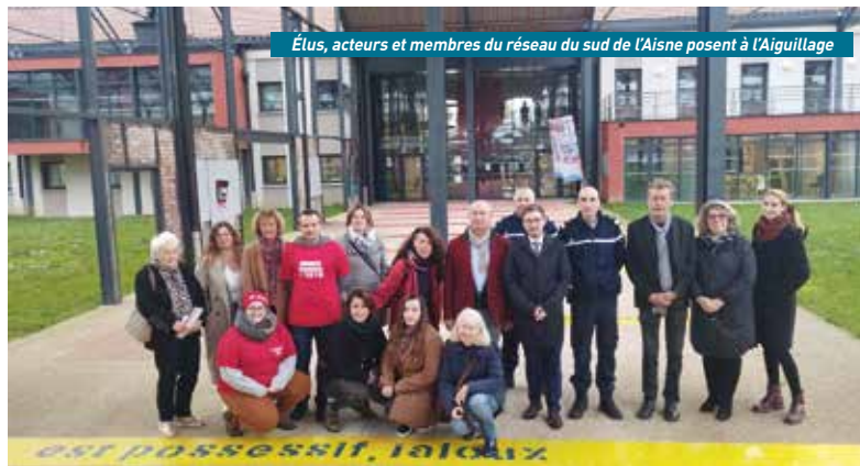
Élus, acteurs et membres du réseau du sud de l'Aisne posent à l'Aiguillage