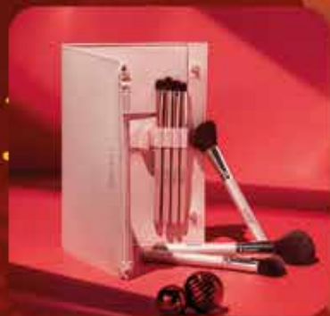
Mes Pinceaux Chéris Coffret & trousse 7 pinceaux visage